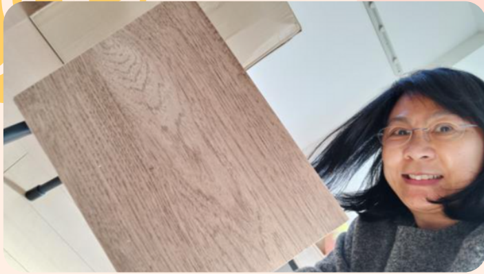
終於，11月中旬搬進了新家 -- 為家裝鉗新傢俬的樂趣