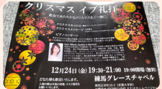
帶有福音信息的聖誕音樂會在日本 很受歡迎。 請為日本教會在這個聖誕節能大膽 和熱情地向許多日本人外展祈禱！