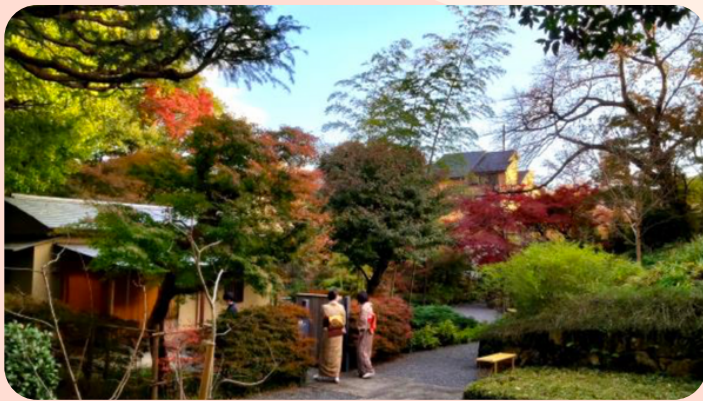
在探索鄰里的同時享受深秋的樹葉顏色