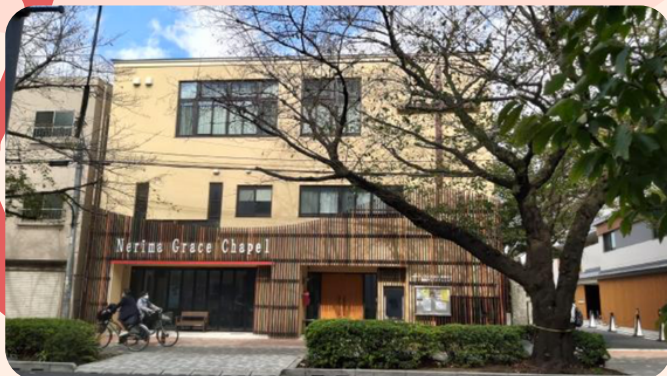
為今年 11 月在 基督聖協團練馬教會 開始事工感恩