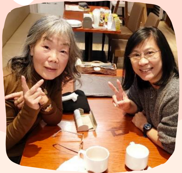
和N女士白花油婆婆午餐， 聊了三個小時

午餐時，白花油婆婆熱情地給我看她去香港、歐洲和加拿大旅行的相冊，並向我講述了她的人生故事。N女士獨自住在札幌，是4兄弟姐妹中最小的一個。之前，她在東京生活了大約50年，並在巴黎4年學習法語和時裝。她在一家時裝公司工作，直到58歲退休。白花油婆婆在巴黎因一個基督徒家庭經歷了一段創傷的經驗。因為她不是家庭成員，在平安夜被拒之門外。在淒涼的冬夜，N女士在附近找到了一座教堂。在這唯一一次參與聚會，她記得牧師給了她一些麵包和酒。臨別前，N女士給了我她的地址，邀請我回札幌時去看望她。請為N女士禱告，祈求上帝讓她對耶穌敞開心扉。